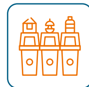
Recollida intel·ligent de residus