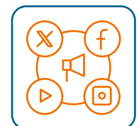
Redes sociales y posicionamiento